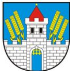
Město Klášterec nad Ohří