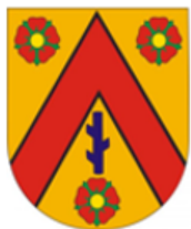
Město Police nad Metují