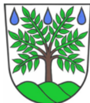
Obec Deštné v Orlických horách