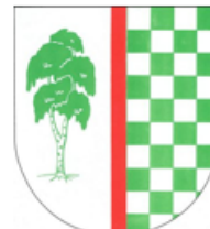
Město Horní Bříza